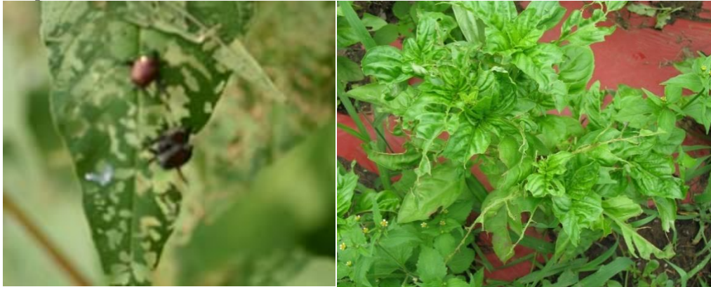
Figuras 1 y 2: Daños por la alimentación de los escarabajos japoneses (a la derecha) y daños por la alimentación de los escarabajos asiáticos de jardín (a la izquierda).

crisantemo, la dalia, el delfinio, la heuchera, el flox, la rudbeckia y la salvia. La albahaca también es uno de los huéspedes favoritos donde deshojan, trituran y agujeran el follaje de las plantas.