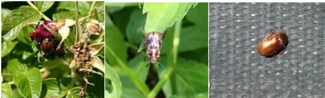
Figuras 3, 4 y 5: Escarabajo japonés adulto, escarabajo oriental y escarabajo asiático de jardín (de izquierda a derecha).

Las etapas larvales de los escarabajos se alimentan de raíces de césped y otras plantas durante los meses de otoño y primavera. Hay una generación al año.